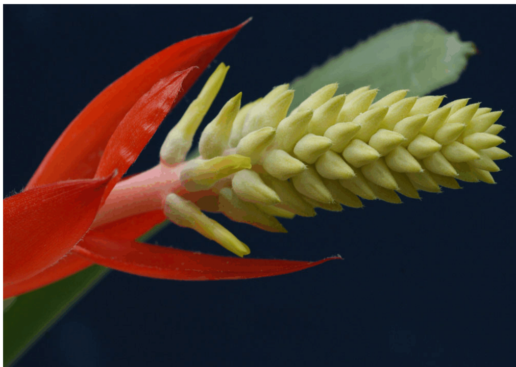
Aechmea nudicaulis var. nudicaulis